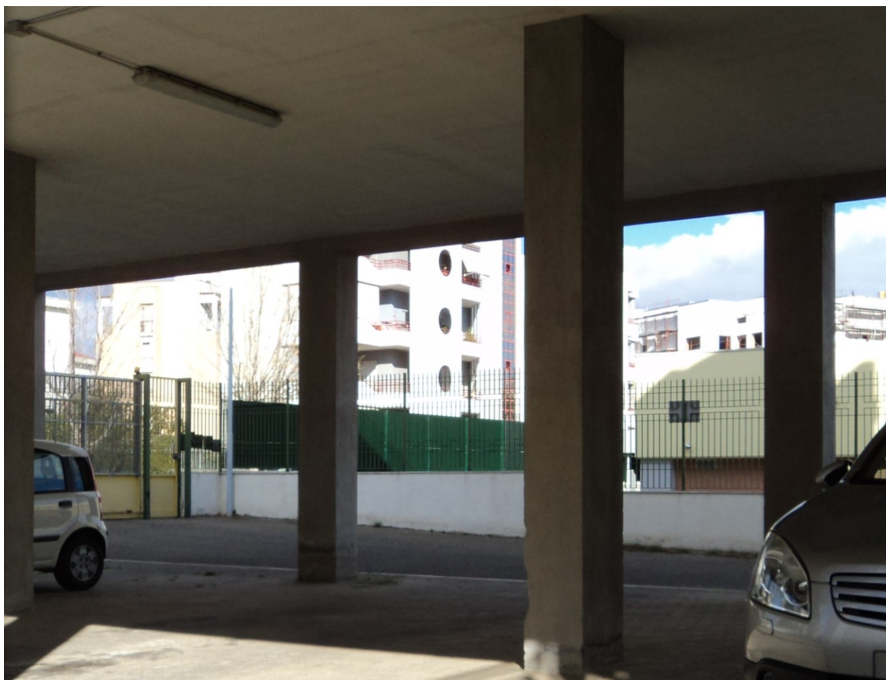
Piano terra su pilotis