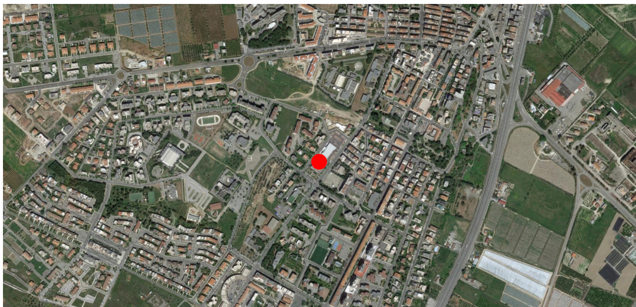
Stralcio ortofoto – Comune di Policoro (MT)