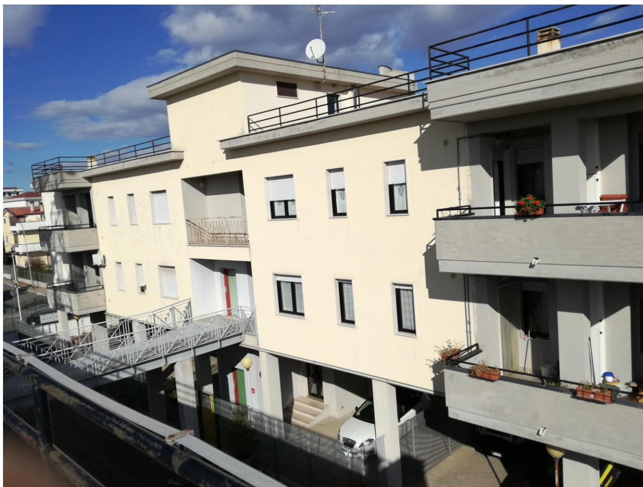
Prospetto interno (lato sud-ovest)