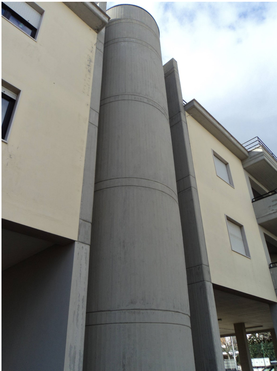
Prospetto posteriore (lato nord-est) - vista esterna del setto semicircolare del corpo scale e dei setti piani adiacenti a tutt'altezza.