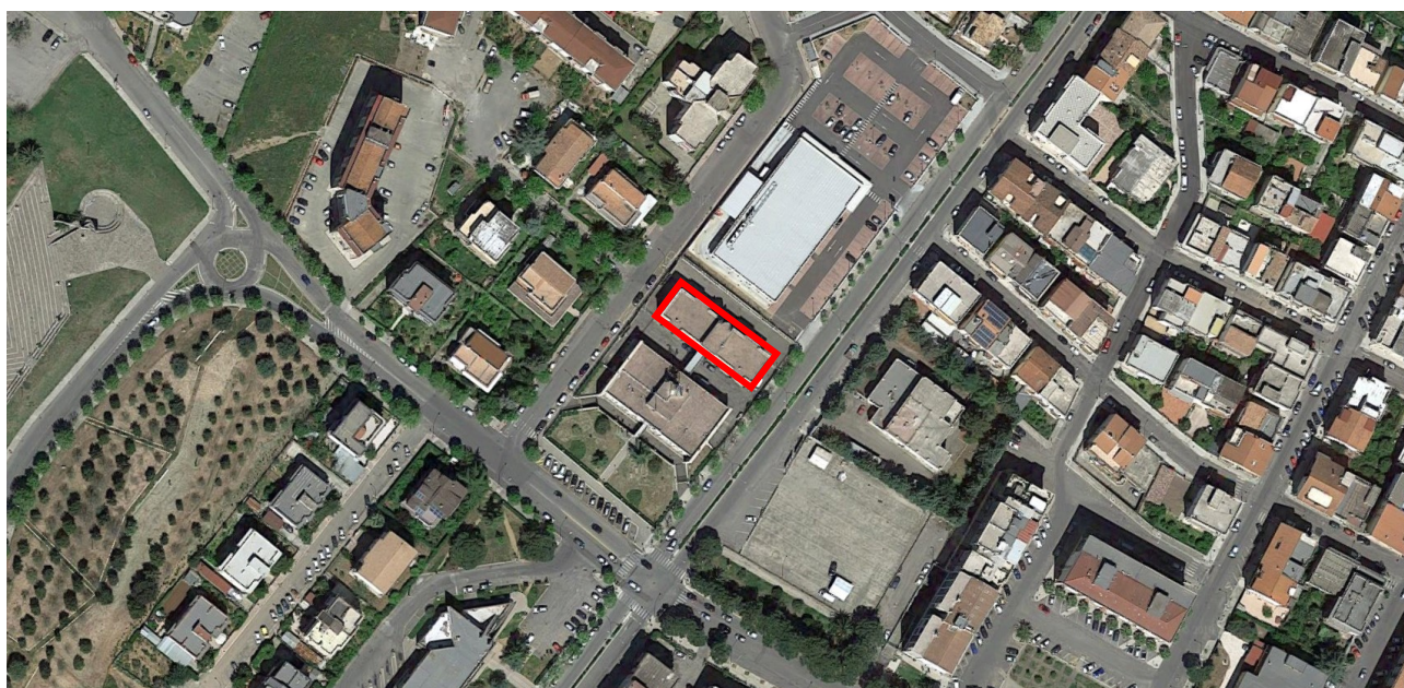
Stralcio ortofoto – Individuazione Edificio Alloggi Guardia di Finanza